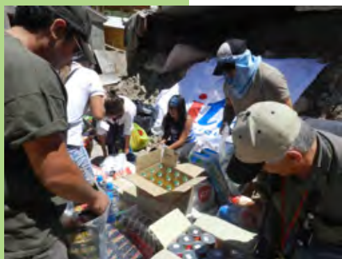
Trabajadores de ITI llevaron ayuda a habitantes de Camiña.

Adicionalmente, está en evaluación la ampliación del muelle de atraque. "En la actualidad podemos recibir barcos de hasta 337 metros de eslora con autorización de la Autoridad Marítima. De materializarse, estaríamos en condiciones de atender naves Post Panamax de hasta 380 metros de eslora", concluyó Ugarte.